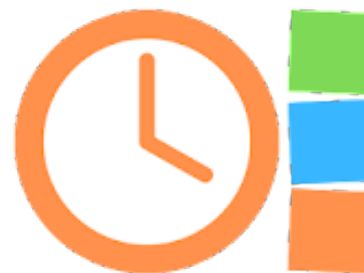
Rutina de diversion.