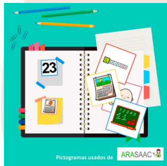
Agenda de Pictogramas